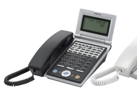
デジタル多機能電話